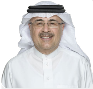
أمين بن حسن الناصر الرئيس وكبير الإداريين التنفيذيين

"واصلت أرامكو السعودية بحمد الله تحقيق نتائج قوية في الربع الأول، كما أحرزنا تقدمًا في تنفيذ أهدافنا الإستراتيجية لتوسيع قدراتنا بمجال الغاز، وكذلك توسيع نطاق أعمالنا في قطاع التكرير والكيميائيات والتسويق على المستوى العالمي.